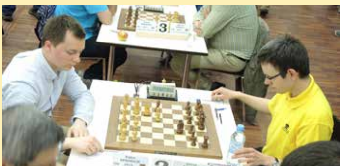
GM Navara D. 2730 ½ : ½ 2590 GM Bindrich F. (C)