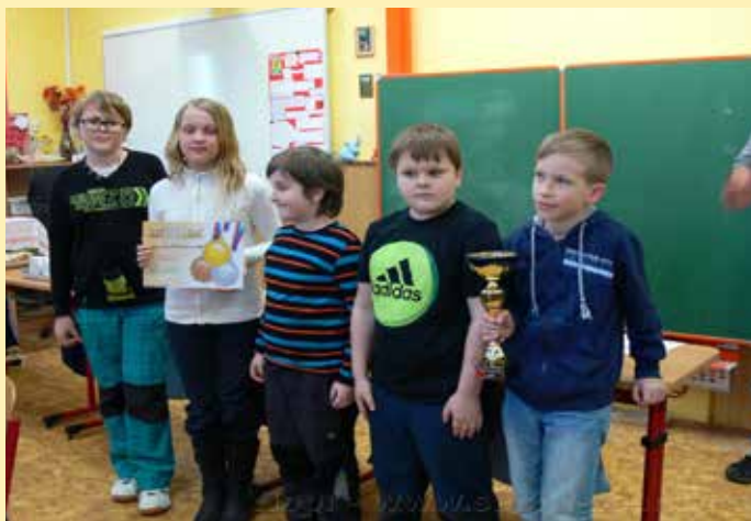
Vítězné družstvo z Libštátu

ZŠ za pomoci ředitelky Jiřiny Jelínkové se postarala o super turnaj se vším všudy. Bylo nám nabídnuto občerstvení a k obědu i kuřecí řízek a to vše zdarma. Za to velký dík.