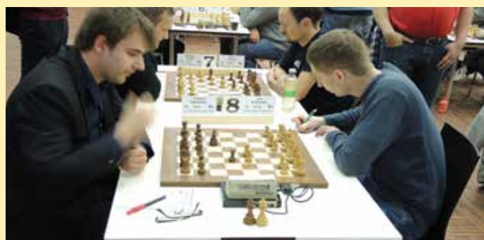
IM Kriebel T. 2465 1 : 0 2340 IM Sodoma J.